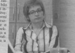
Udruga za razvoj visokoga školstva »Universitas«