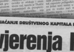
Udruga za razvoj visokoga školstva »Universitas«