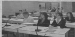
Predstavnici riječkoga sveučilišta sudjelovali na konferenciji sa sudjelovateljima znanstvenih i obrazovnih institucija u Tehničkom fakultetu

stru i znanstvenih instituta i vjerske svadljive mogućnosti i poteske - bila je tema video-konferencije održane prije desetak dana na kojoj su sudjelovali američke, znanstvene poticajne grupe (SIG), američki sveučilišta u Princetonu i Seattleu, te predstavnici Ministarstva znanosti, obrazovanja i sporta (MZOS), Nacionalne zaklade za znanost, školstvo i tehnološki razvoj RH, Instituta »Kardinal Steuclitius« i Međunarodnog instituta za istraživanje Jostea (MeiJISA) iz Seila, iz Rijeke sudjelovali predstavnici Rektora Sveučilišta u Rijeci, Zbislav Sveučilišta u Jahnčkom, kultura i ostali savjetnici riječkih sveučilišta.